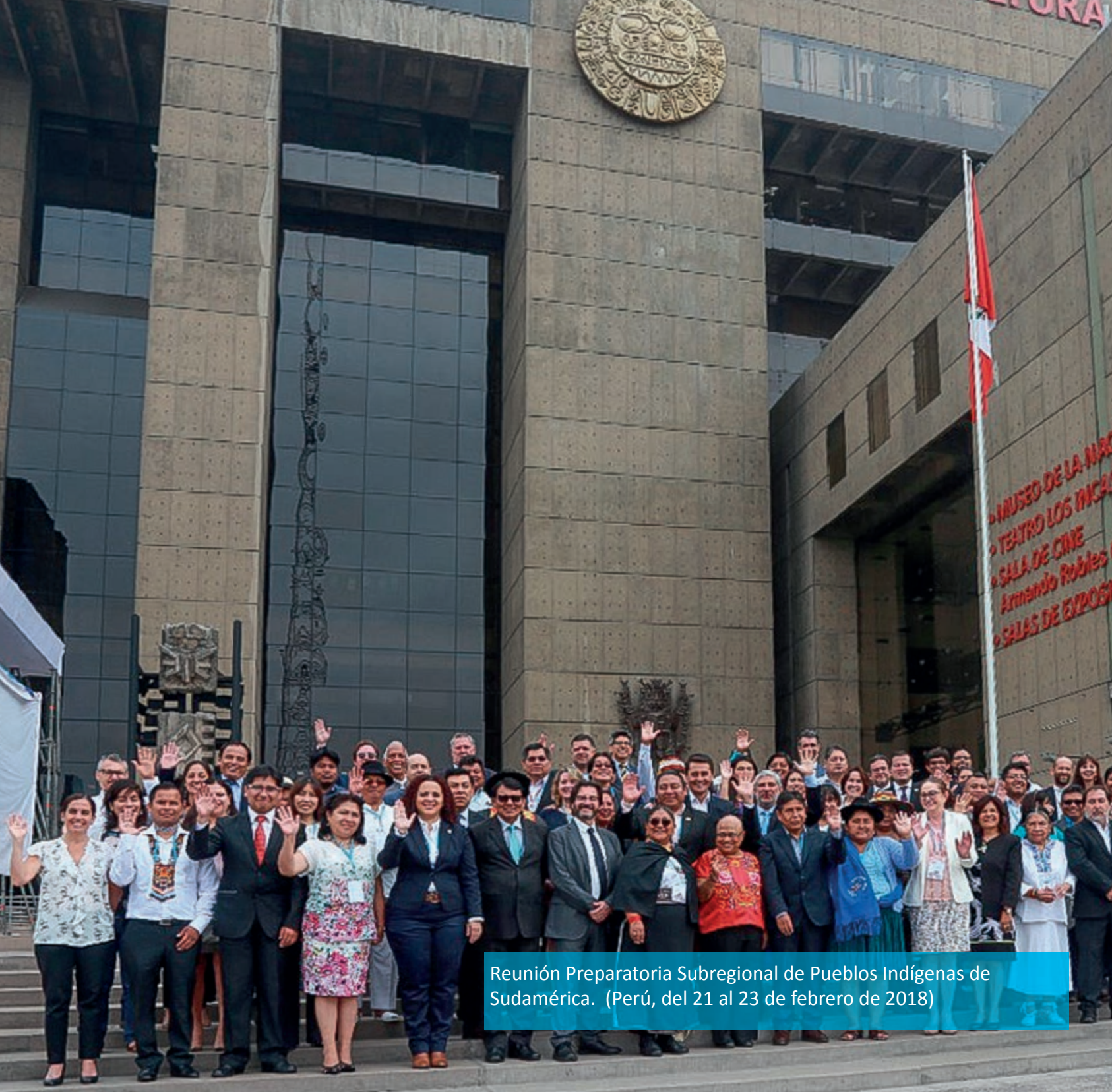
Reunión Preparatoria Subregional de Pueblos Indígenas de Sudamérica. (Perú, del 21 al 23 de febrero de 2018)