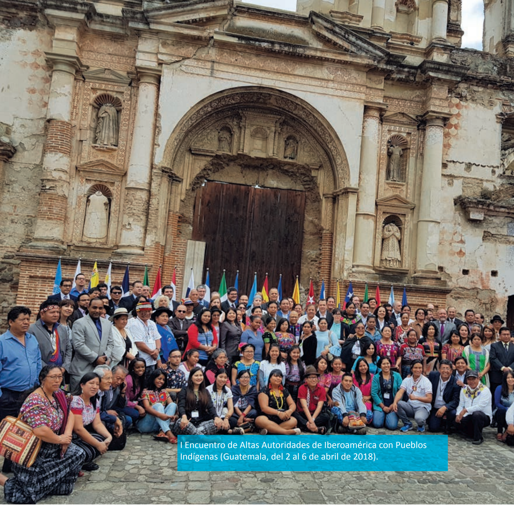
I Encuentro de Altas Autoridades de Iberoamérica con Pueblos Indígenas (Guatemala, del 2 al 6 de abril de 2018).