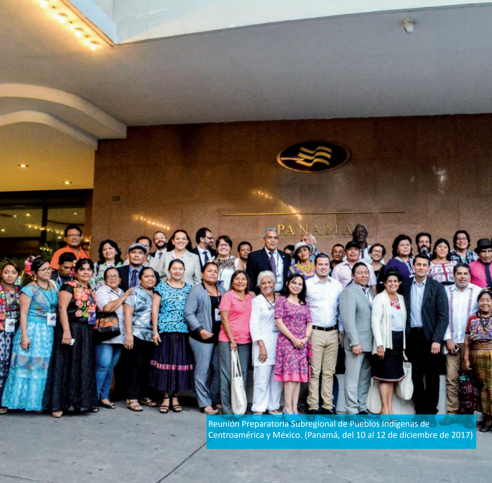
Reunión Preparatoria Subregional de Pueblos Indígenas de Centroamérica y México. (Panamá, del 10 al 12 de diciembre de 2017)